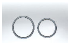
Cromo brillo 3080010038