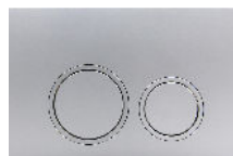
Cromo mate 3080010036