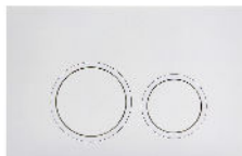
Blanco mate 3080010035